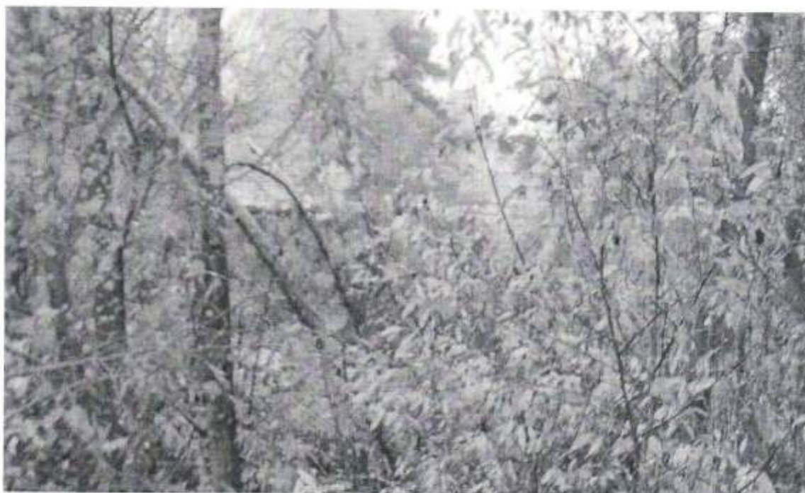
Земельный участок 50:01:0050214:308 МО Талдомский район п. Запрудня, ул. Кооперативная